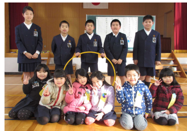
【6名の可愛い新入生と最上級生になる5年生】