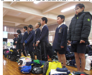
【城島中学校の入学説明会で】